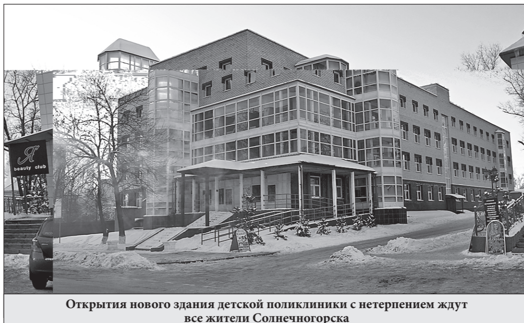
Открытия нового здания детской поликлиники с нетерпением ждут все жители Солнечногорска