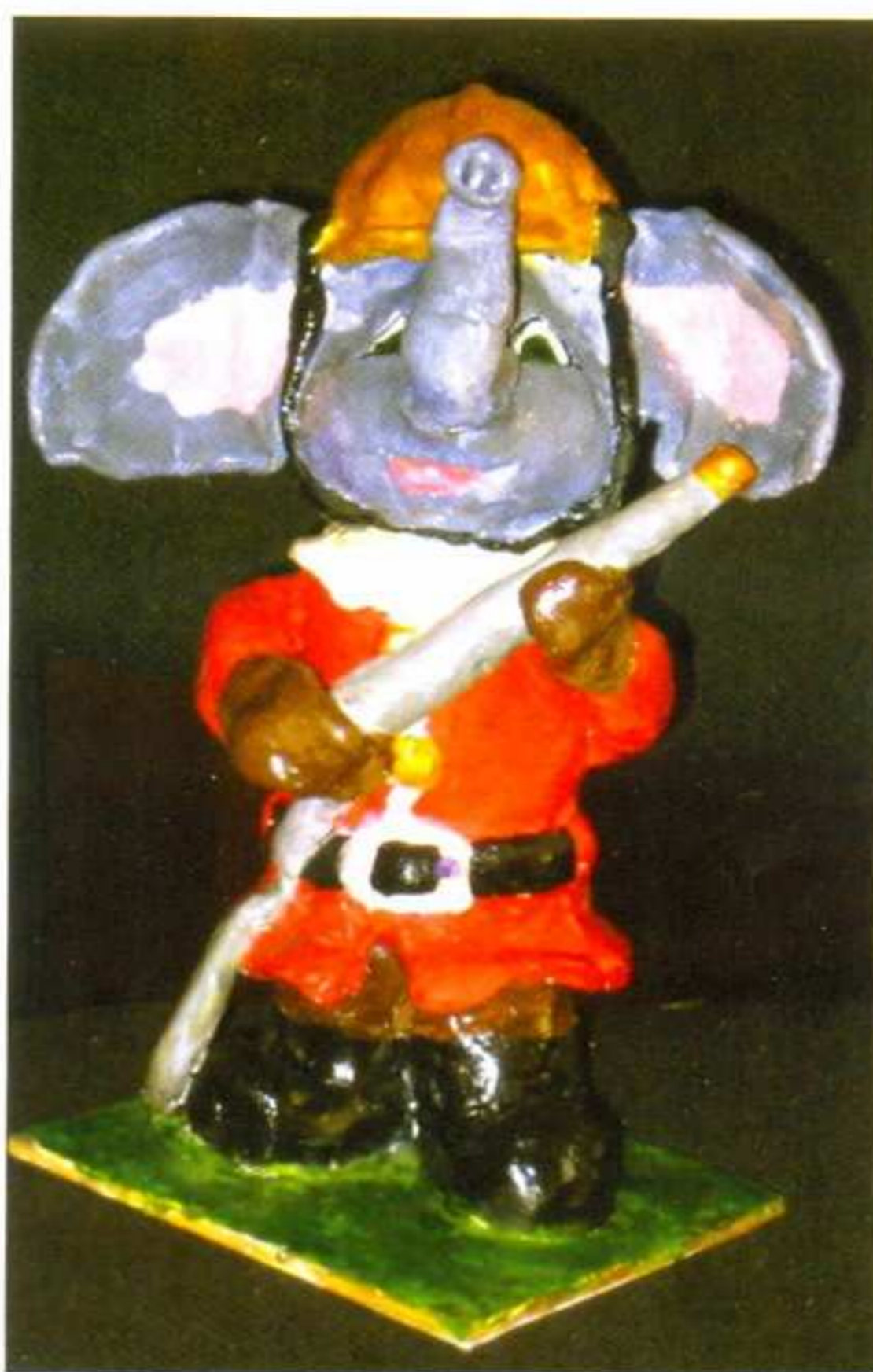
Слон-пожарный. Работа Алёны Большовой.

...Мы приглашаем всех ребят попробовать свои силы во Всероссийском конкурсе детского творчества по пожарной безопасности «Пожарный-доброволец: вчера, сегодня, завтра!», а также стать участником и, конечно же, победителем увлекательнейших конкурсов, которые мы подготовили для вас в рамках фестиваля «Детям Подмосковья – безопасную жизнедеятельность».