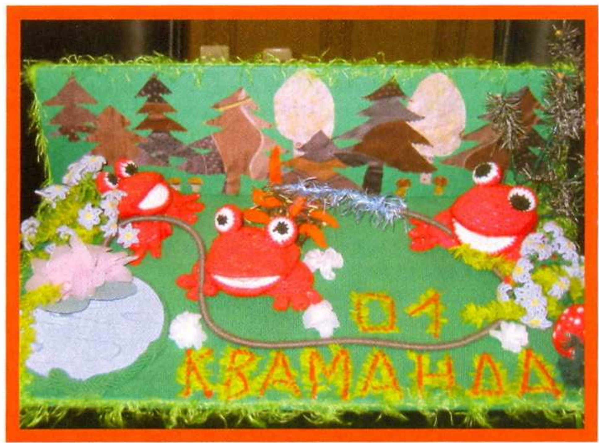
«Кваманда 01». Работа Анны Масюк.

Работа «Берегите лес!» выполнена воспитанниками старшей группы детского сада № 13, г. Наро-Фоминск.