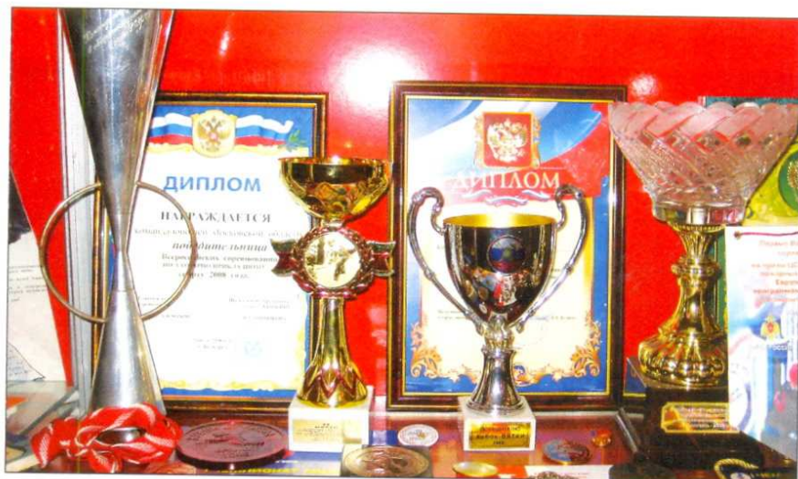
Кубки и грамоты победителей в соревнованиях по пожарно-прикладному спорту